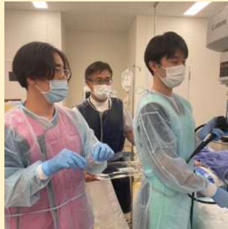
胆膵内視鏡治療の様子