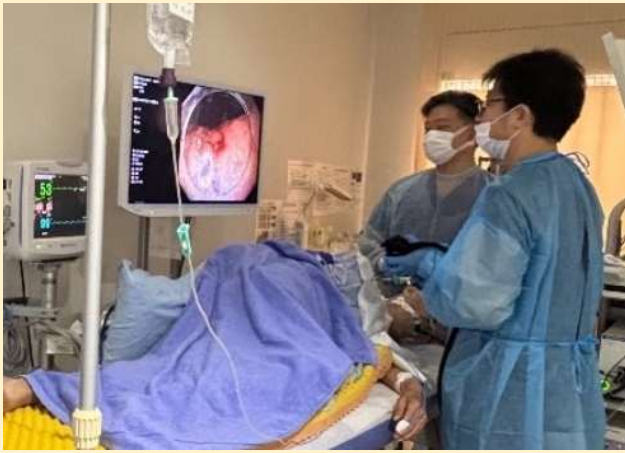
上部消化管 ESD 治療の様子