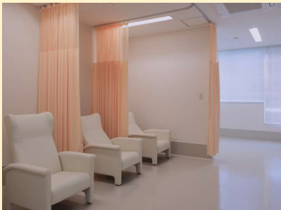
消化器センター 前処置室