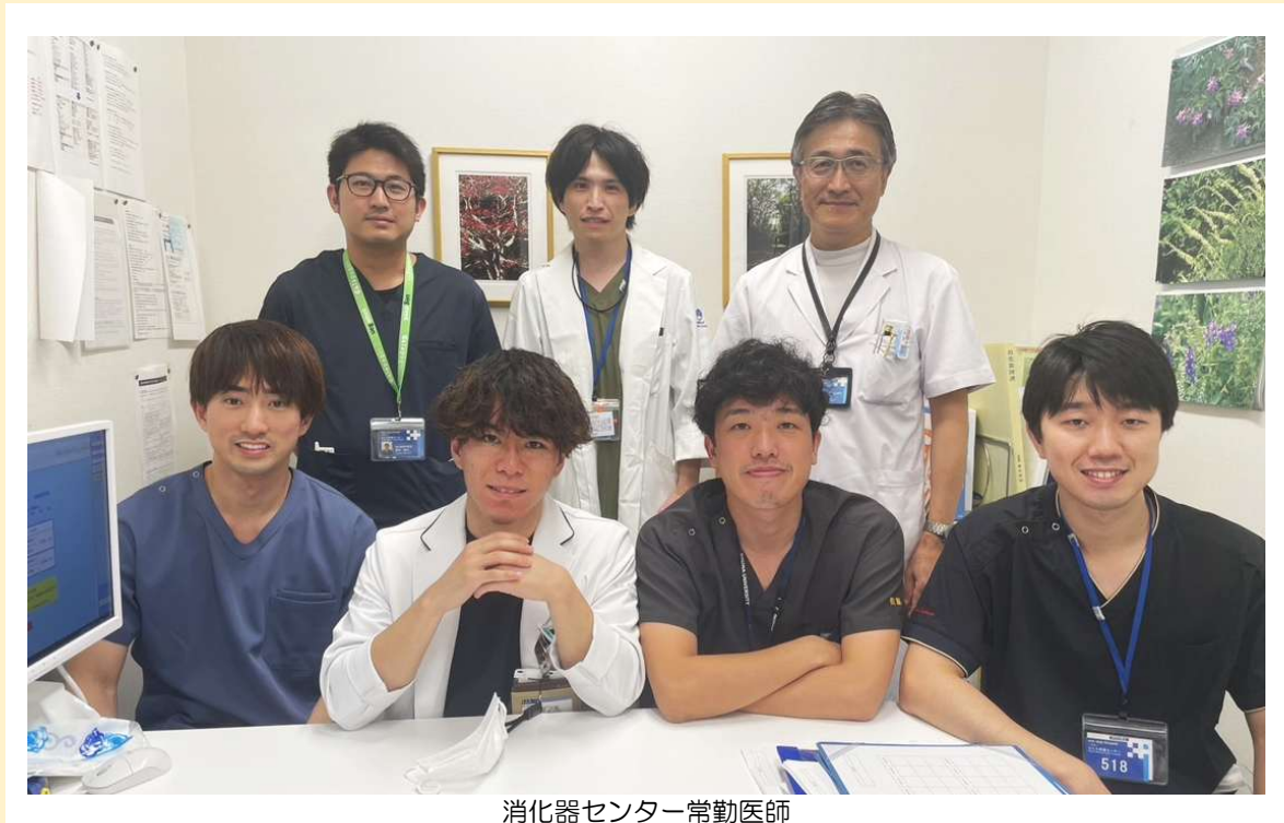
消化器センター常勤医師

消化器センターでは10名の医師（常勤内科医4名、外科医3名、非常勤内科医3名）で日々の診療を行っています。朝のミーティングに始まり救急症例の検討、病棟のカンファレンスを行った後に朝回診を行い、午前9時から外来、病棟、内視鏡、外科手術、救急対応と分かれての診療となります。今回はその中でも、内視鏡センターにおける上部消化管内視鏡について、胃カメラに絞ってお話しします。