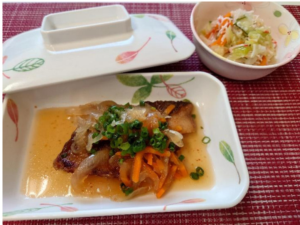
*メバルの南蛮漬け *かにサラダ