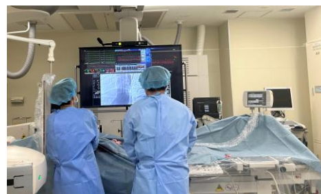
心臓カテーテル治療の様子

高齢者や糖尿病患者では心筋虚血が発症しても症状が出ないことがありますので、無症状であっても検査所見に異常がありましたら遠慮なく紹介ください。心筋虚血患者さんの中には冠動脈に石灰化病変を有している治療難易度の高い症例もいますが、当院では石灰化病変を切削するデバイス (Rotablator や Diamondback) を用意しており、難易度の高い症例にも十分に対応が可能でありこれまでも良好な成績を収めております。