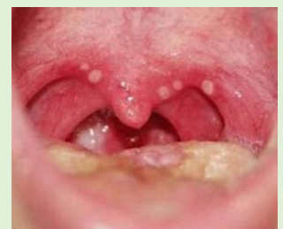
ヘルパンギーナの咽頭所見 典型例

今、 手足口病 ヘルパンギーナ が大流行していますが、これらの原因ウイルスであるコクサッキーやエコーウイルスの 診断キットはない です。あくまでも見た目での判断となります。 手のひらや足や臀部に赤いぶつぶつ ができますから、通常の典型例は、誰でも判断可能です。保育園の先生もたくさんみられていますので保育園で判断されることが多いようです。